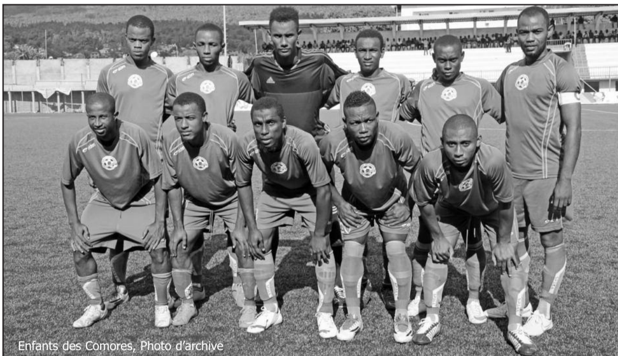
Enfants des Comores, Photo d'archive

Volcan # Aventure : 1-1 Fc Male # Us Mbeni : 1-0 Jacm # Apaches : 3-2 Abeilles # Usz : 0-0 Ngaya # Elan : 2-1 Amicale # Enf. Com : 1-5